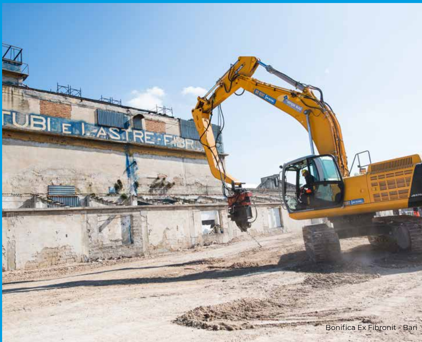
Bonifica Ex Fibronit - Bari

Nell'ambito dell'attivazione di un sistema di reti territoriali, il Gruppo AVR si impegna ad incoraggiare la partecipazione a protocolli d'intesa (o patti similari) tra soggetti pubblici, imprese, associazioni di categoria ed organizzazioni sindacali, volti a prevenire le infiltrazioni criminali ed a promuovere sviluppo e legalità nell'ambito del territorio in cui si trova ad operare.