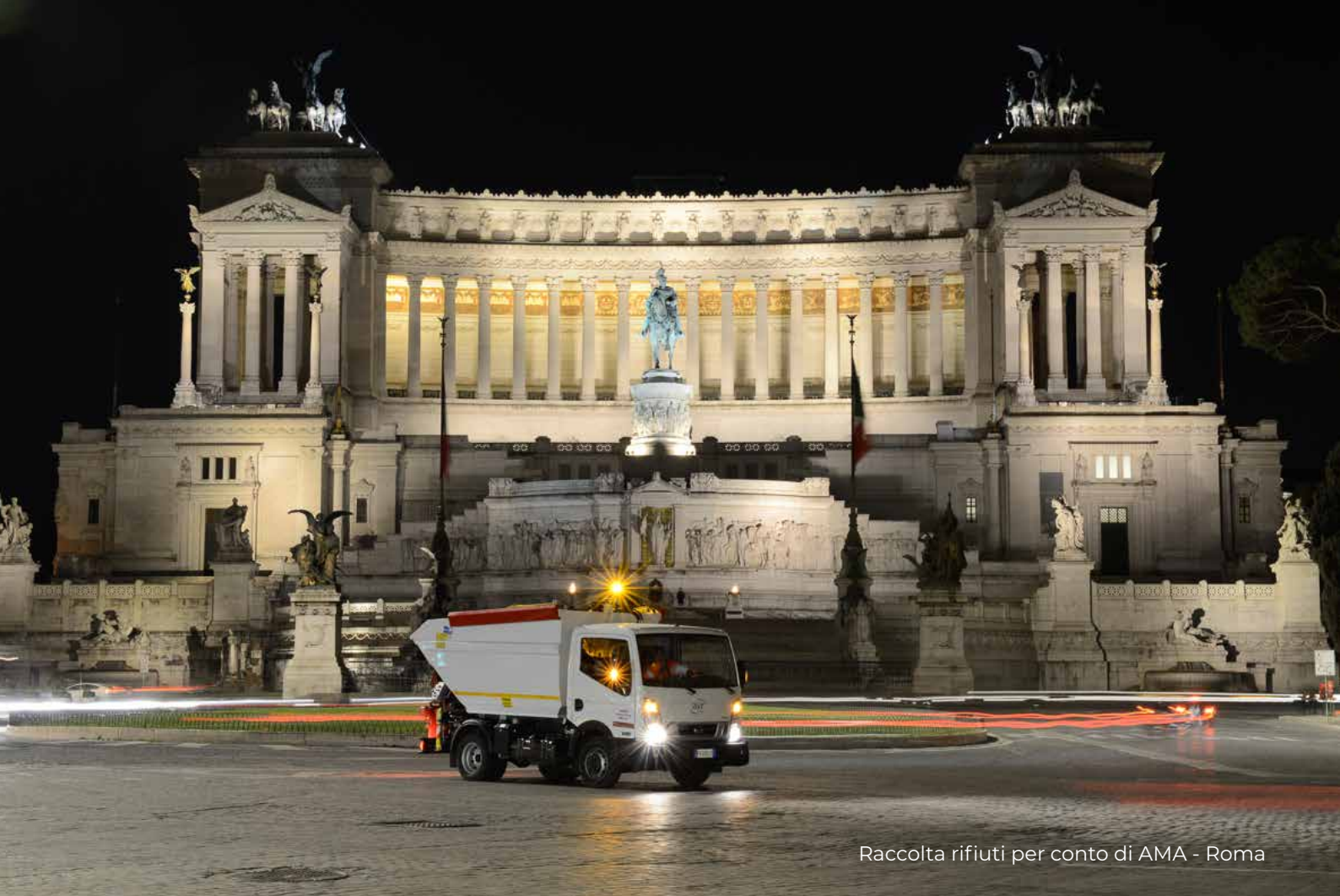
Raccolta rifiuti per conto di AMA - Roma