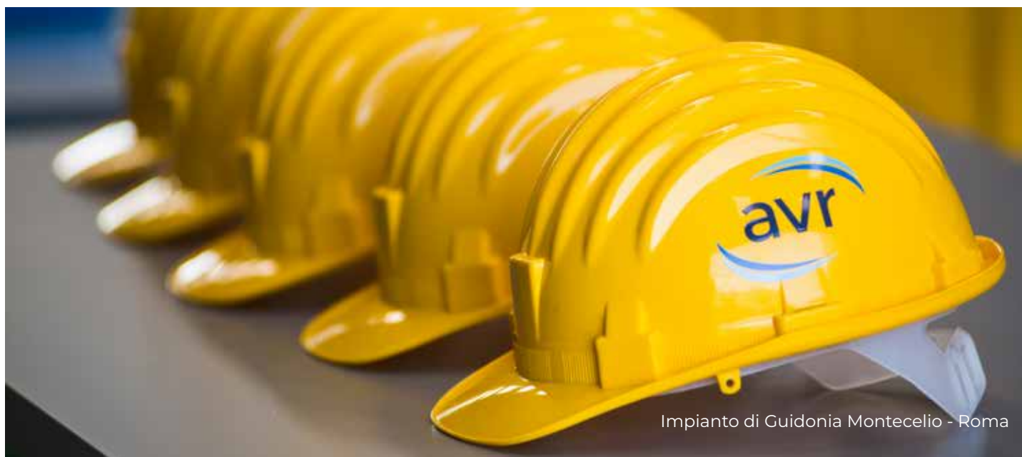
Impianto di Guidonia Montecelio - Roma

Il presente Codice di Condotta Antimafia (di seguito in breve “Codice Antimafia”) è adottato dal Gruppo AVR quale specifico protocollo, ai sensi dell’art. 6 del D.lgs. 231/2001, per la prevenzione dei reati di cui all’art. 24 ter del predetto decreto, nonché per la prevenzione di qualsiasi forma di condizionamento diretto o indiretto dell’attività d’impresa da parte della criminalità organizzata. In questo senso costituisce uno strumento ulteriore di gestione e controllo (governance) dell’azienda al fine specifico di fronteggiare i rischi da contaminazione mafiosa.