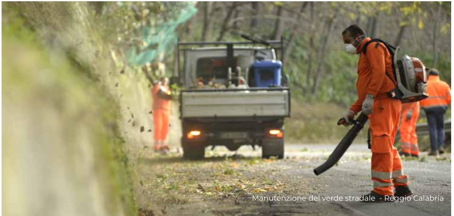
Manutenzione del verde stradale - Reggio Calabria

Il personale deve essere informato e “formato” su quanto previsto dal presente Codice Antimafia e, più in generale, sulla legislazione antimafia . È fatto divieto al personale di tenere qualsiasi comportamento in grado anche solo potenzialmente di manifestare a soggetti terzi orientamenti o decisioni assunti dal Gruppo AVR o che la società intende assumere, fatta salva la previsione di specifiche procure o deleghe.